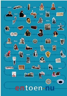
Wandkaart 2007 bij de Canon van Nederland. Wall chart accompanying the 2007 Canon of Dutch history.