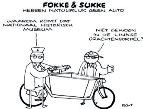
Commentaar op de plaats van het Historisch Museum. Fokke and Sukke suggest a location for the National History Museum.