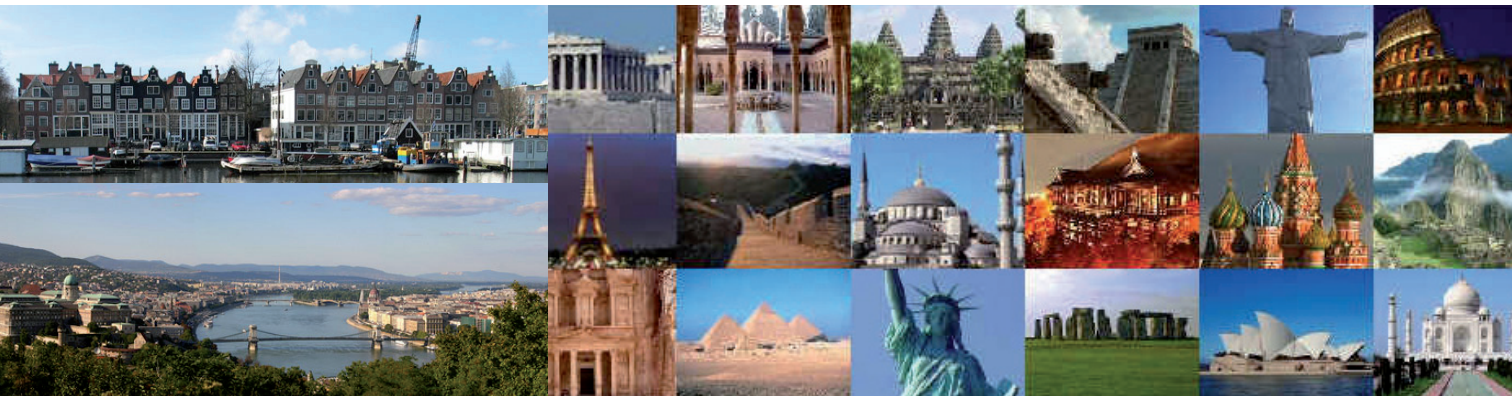
Nieuwe Wereldwonderen en Werelderfgoed. New Wonders of the World and World Heritage sites.